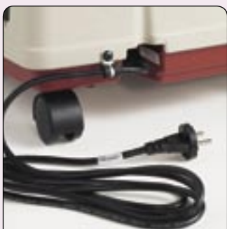
Conexión reforzada del cable de corriente

Invacare® le ofrece el mejor valor añadido en un concentrador, ya que no existe costo de envío ni gasto de mantenimiento por 5 años.