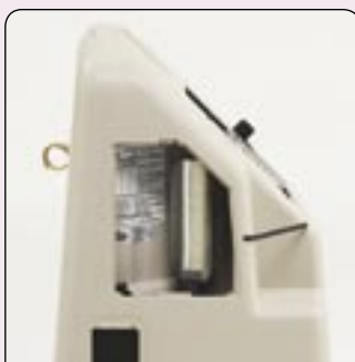
Únicamente un filtro a cambiar en los controles