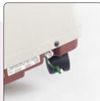
Puerto de conexión para HomeFill®