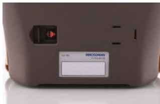
Etiquetas para registro y gestión de la información