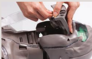
Inserte el pulmón artificial En su localización