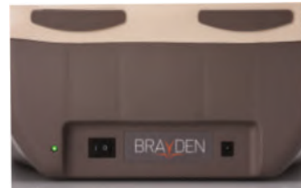
Dos maneras de funcionamiento: baterías o alimentador AC/DC