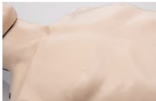
Piel y accesorios inocuos.