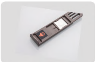
Señal audible que ayuda a corregir la profundidad de la compresión (Cliker on/off)