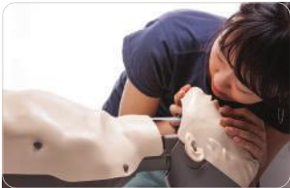
Movimiento del pecho muy realista con ventilación

Inclinación realista de la cabeza y elevación de la barbilla para abrir las vías aéreas Elevación del pecho con ventilación correcta Reacción audible ("clic") con profundidad de compresión correcta