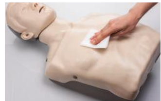
Se limpia rápida y fácilmente