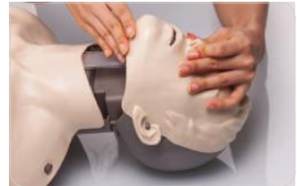
Conductos nasal y oral que permiten pinzar la nariz