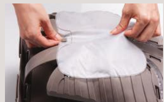
Coloque el pulmón en el pecho Según marca las guías.