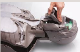
Previamente levante la barbilla