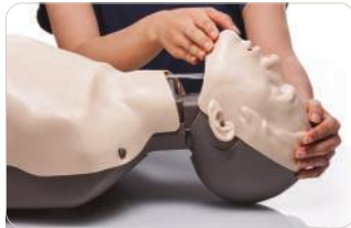
Inclinación de cabeza y elevación del mentón para abrir la vía aérea