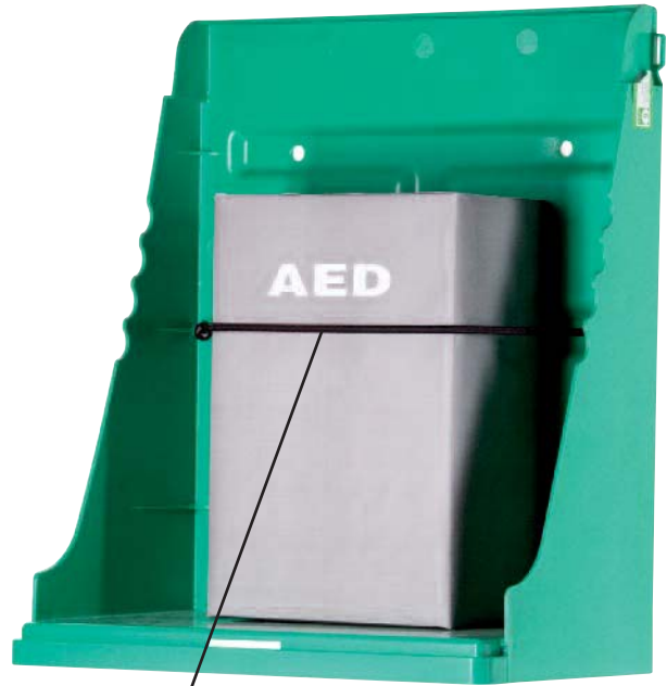
Correa que sujeta AED/DAE

A = 400 mm, A = 341 mm, P = 198 mm, Peso = 1,5 kg