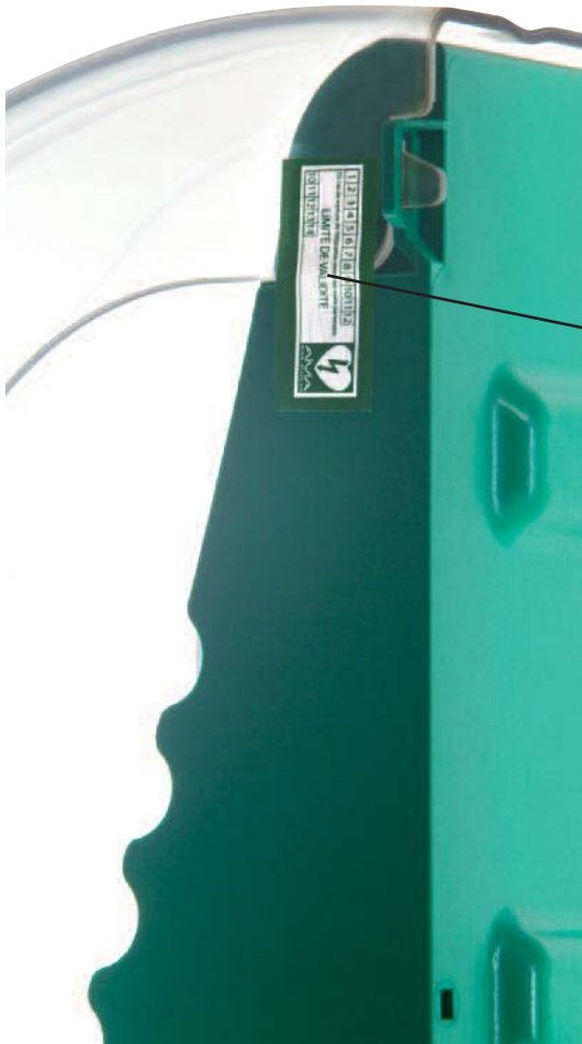
Adhesivo de sellado de protección