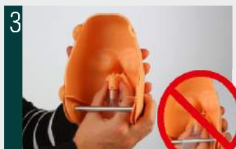
3. El pulmón debe ser colocado por debajo de la varilla metálica, nunca por encima.