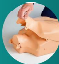
PETO (Ref. Chest-MB)