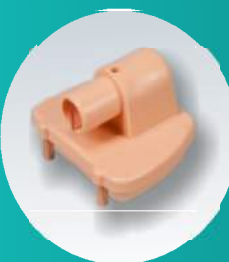
VÁLVULA (Ref. SP-002)