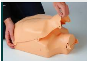
1. Retirar el peto.