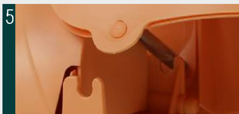
5. Conectar la cabeza al torso encajando la varilla metálica en los enganches situados en ambos lados del cuello.