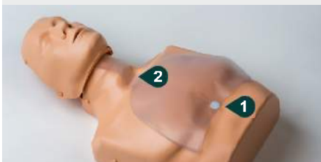
6. Colocar el pulmón sobre el torso y comprobar: Que la pegatina se fija en la marca circular Que el pulmón descansa a holgadamente sobre el cuello