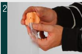
2. Unir la boquilla con la válvula.