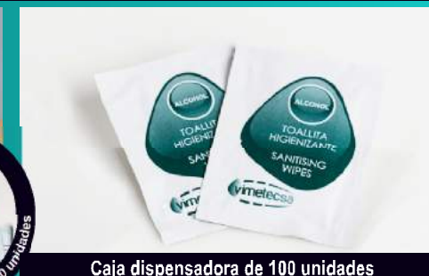
Caja dispensadora de 100 unidades

La protección durante la formación, se complementa con el uso de la mascarilla protectora para la práctica del boca a boca.