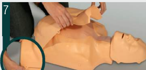
7. Colocar el peto.

Para asegurar una máxima higiene, el fabricante recomienda la limpieza de Practi-Man después de cada uso siguiendo las instrucciones a continuación: