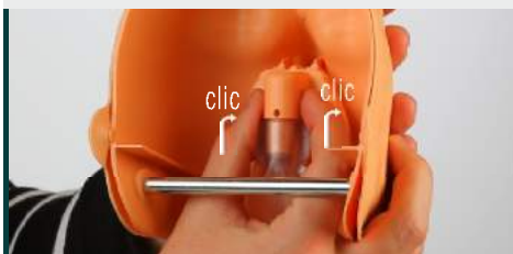
4. Presionar las pestañas de la parte superior de la pieza en la cabeza y presionar hasta oír el clic.