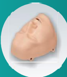
MÁSCARA (Ref. Face-MB)